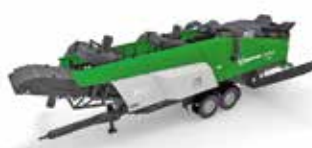
Zwei in einer: der Hurrifex Stein- und Leichtstoffseparator