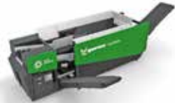
Sieben mit Stern: die Multistar Sternsieb