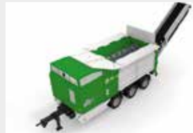
Weniger Verbrauch, mehr Leistung: der Crambo direct Zweiwellenzerkleinerer