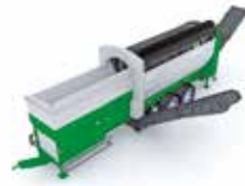
Trommelwirbel: die Cribus Trommelsieb

Wir wissen, dass wir nicht allein dafür verantwortlich sind, dass die Welt immer grüner wird. Aber auf unsere Lösungen für die Behandlung von Abfällen und Biomasse sind wir trotzdem ziemlich stolz.