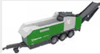
Schreddern und Hacken leicht gemacht: der Axtor Universalzerkleinerer