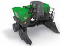
Design pur: der Topturn Kompostumsetzer